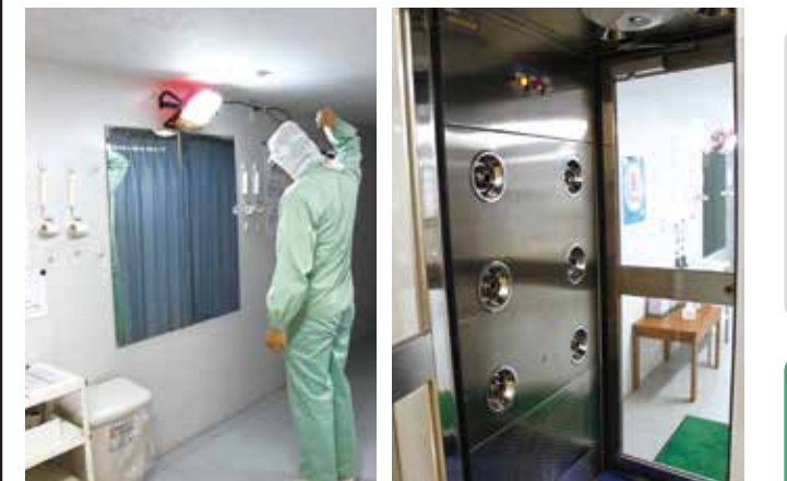
入室の際は、ローラー掛け手洗いアルコール消毒エアシャワーームを通るなど、入念な衛生管理が行われている。

A) 入室手順などの一般衛生管理や製品のトレーサビリティ管理は、すでに取り組んでいました。