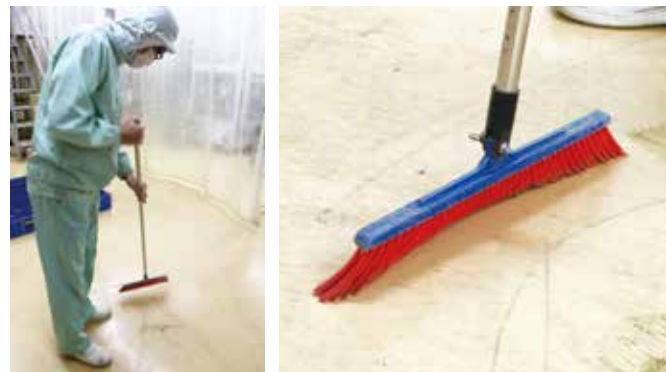
実際の掃除風景。ブラシのほどよい「たわみ」が、お茶の微粉を残さずかき集める。

当社では、昼前、夕方の1日に2回と、製品の切り替え時や、汚れていると思った時に、パートさんにほうきで掃除をしてもらっているのですが、そちらからの評判も上々ですよ。