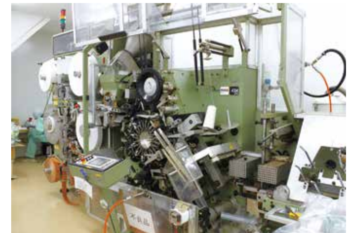
工場内にはティーバッグやテトラ型/バッグを加工、充填するための機械が並んでいる。