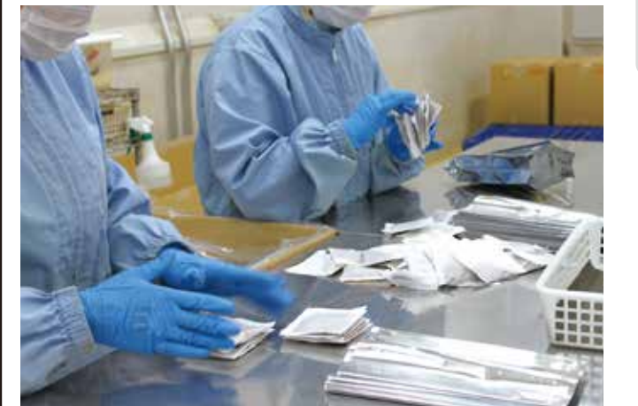
従業員が着用しているユニフォームや手袋もすべて食品工場に対応。

また、設備面のチェックも行いました。例えば、ビニール袋ひとつ取っても、それが食品対応かどうかを調べなければいけません。使っている資材や機材ひとつひとつについて、電話でメーカーまで問い合わせ確認していきました。その中で、床の掃除用に使っていたほうきも、食品工場対応なのか気になりました。